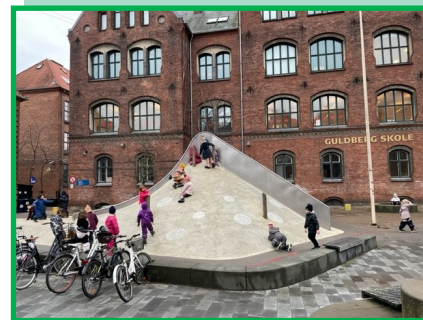
Farvel og på gensyn til palmen

Lærerne vil invitere jer forældre til at komme og se pavillonerne indvendigt og hvor jeres barns klasse er.